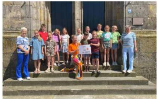
De groep van Tubbergen met KiKa

De groep van Tubbergen heeft gekozen voor Kika (Stichting Kinderen Kankervrij) en heeft op 27 mei € 260,60 overhandigd aan Kika.