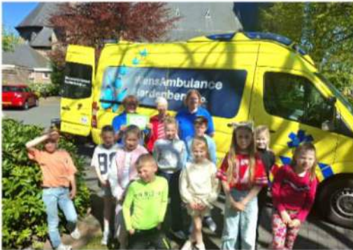
De groep van Geesteren met de wensambulance

Er was afgesproken dat de kinderen, als vrienden van Jezus, van het geld dat ze met hun Eerste H. Communie zouden krijgen iets af zouden staan aan mensen die een steuntje in de rug kunnen gebruiken. De groep van Geesteren koos voor de wensambulance en heeft op 22 april € 310,00 gedoneerd aan de wensambulance.